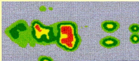
Rg 40 Kern ohne EUCATHERM C ® Auflage

Erhöhter Druck in Schulter und Beckenbereich verursacht unruhigen Schlaf !!!